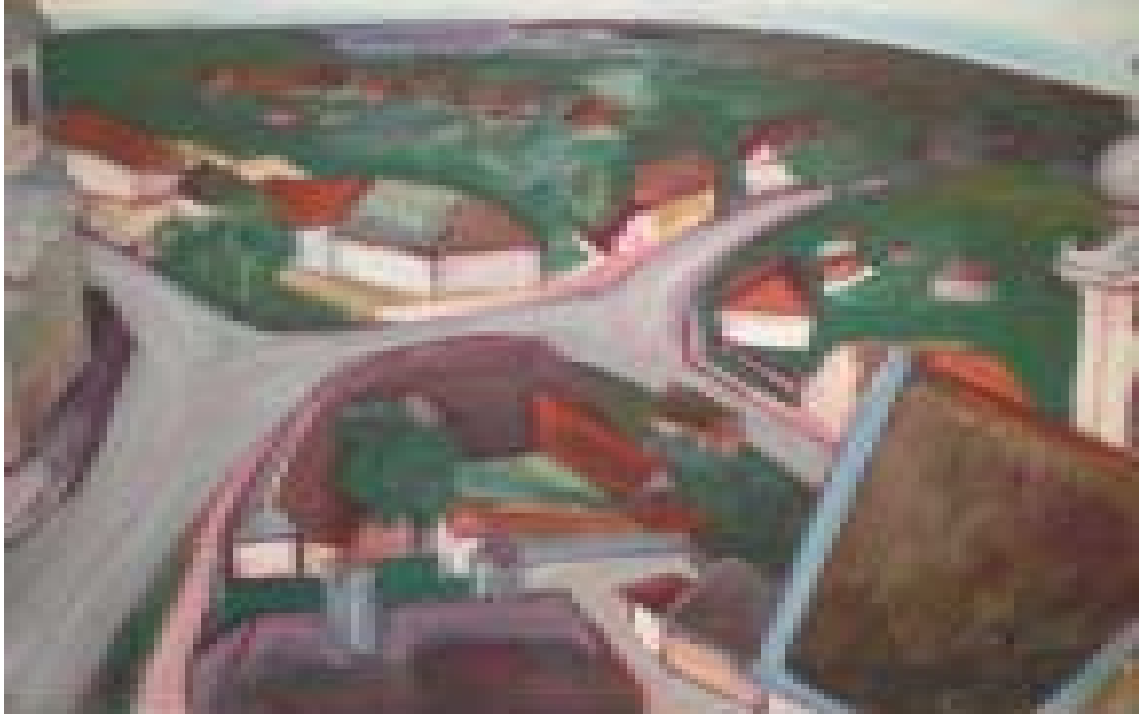
Vedere din turn