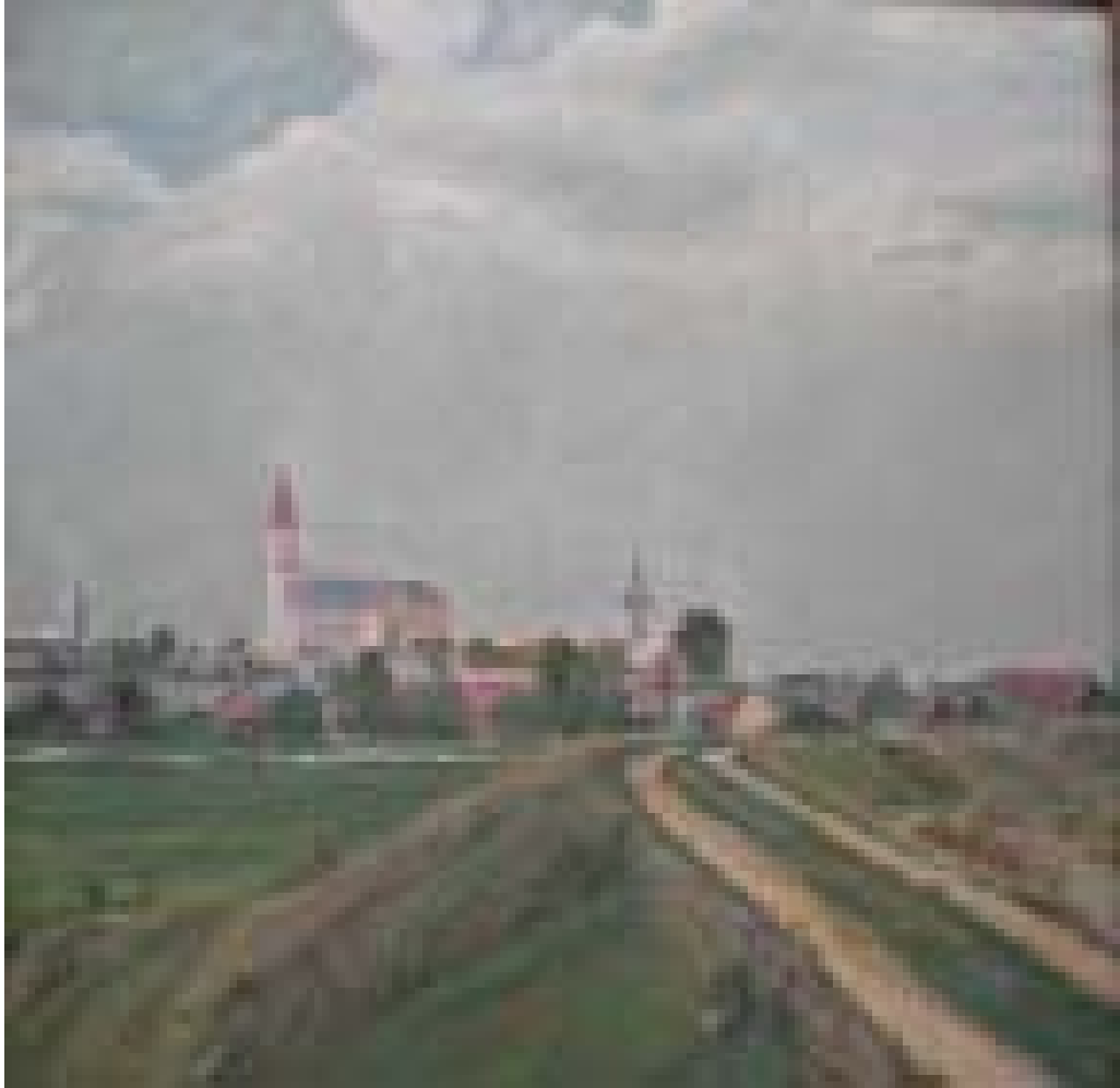
Cenad – vedere de pe dig