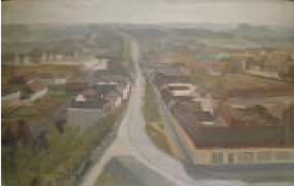
Cenadul – panorama