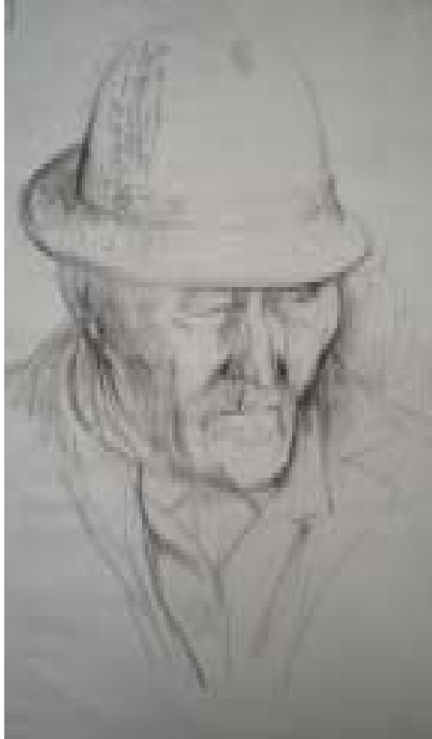
Portret – tata