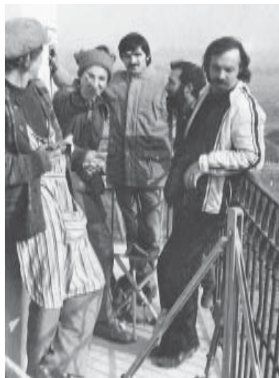
1983. În turn