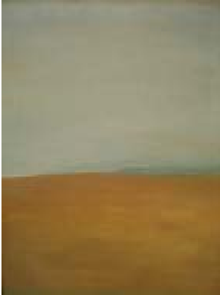
Lan de grâu