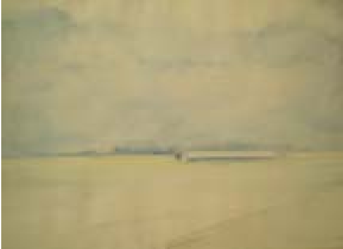
Peisaj din Cenad