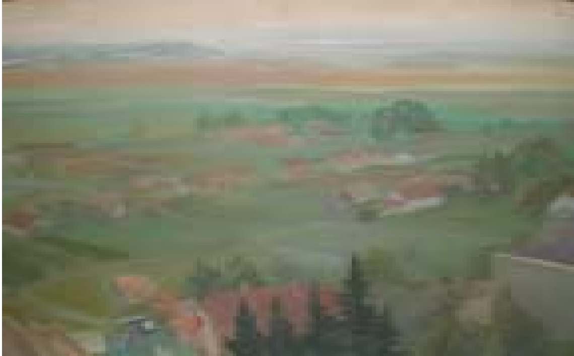
Cenadul – peisaj din turn