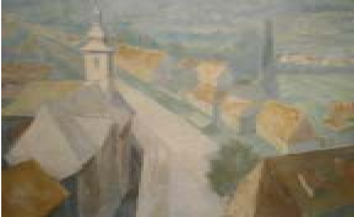
Peisaj din turn