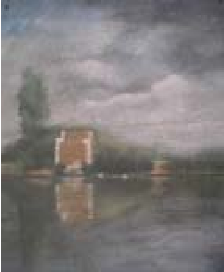
Picior de pod