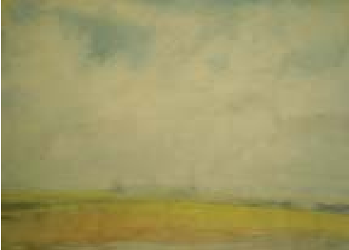
Câmp la Cenad