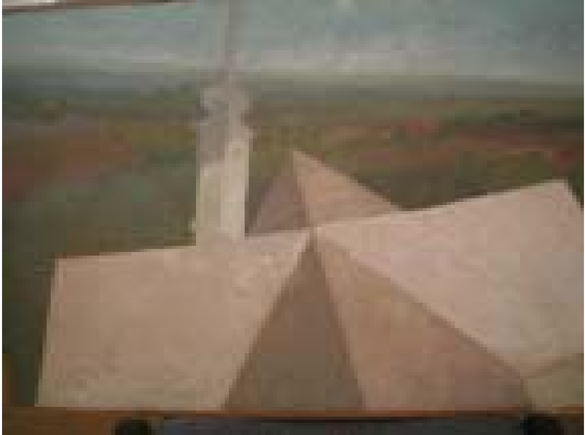
Cenad – vedere din turn 1