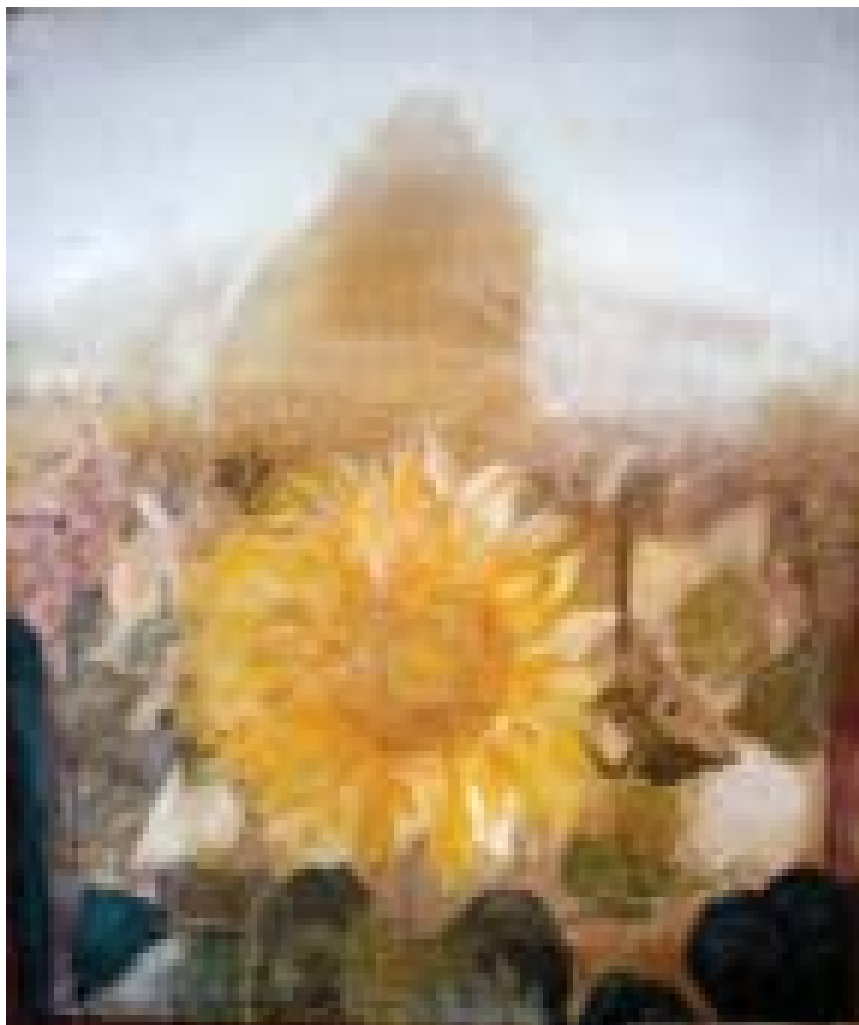
Floarea soarelui – In memoriam Nichita Stănescu