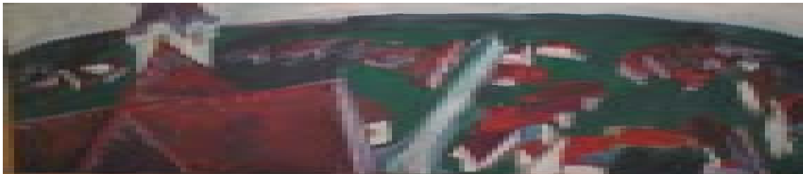
Cenad – panorama