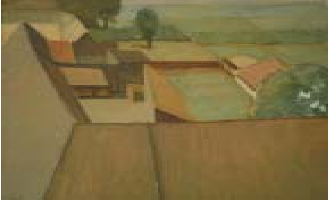
Cenadul – vedere din turn