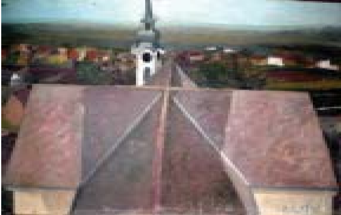
Cenad – vedere din turn