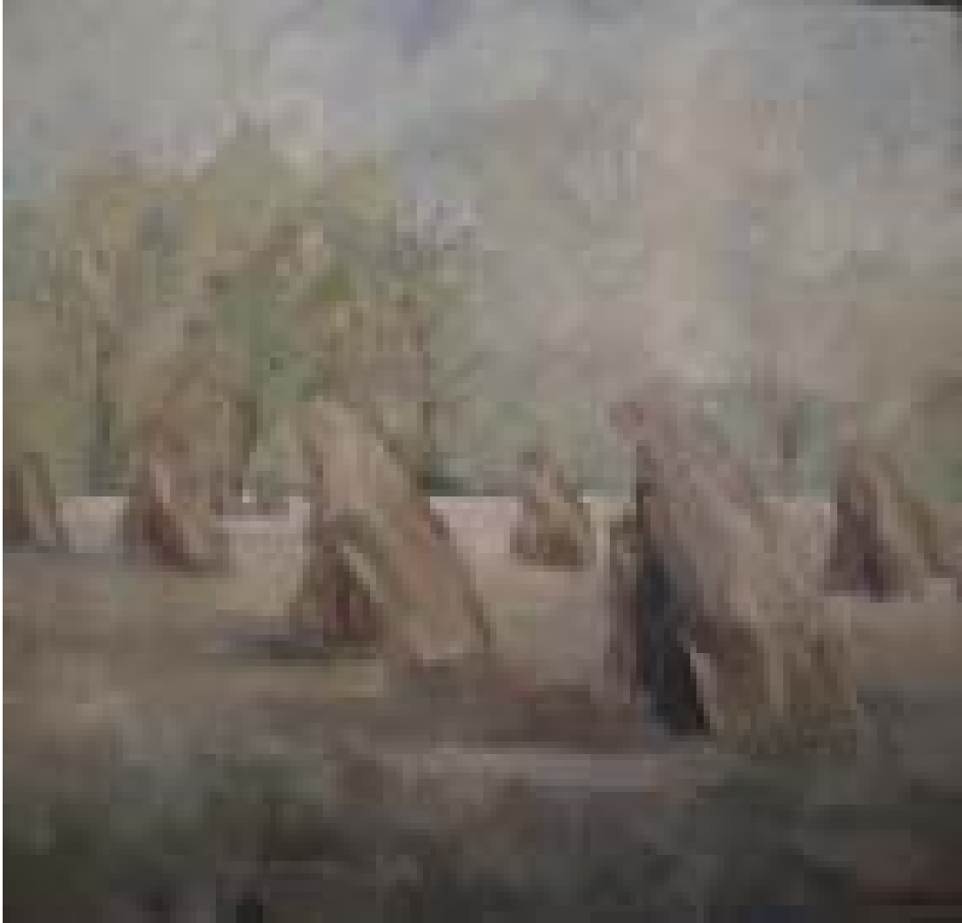
Stoguri de tului