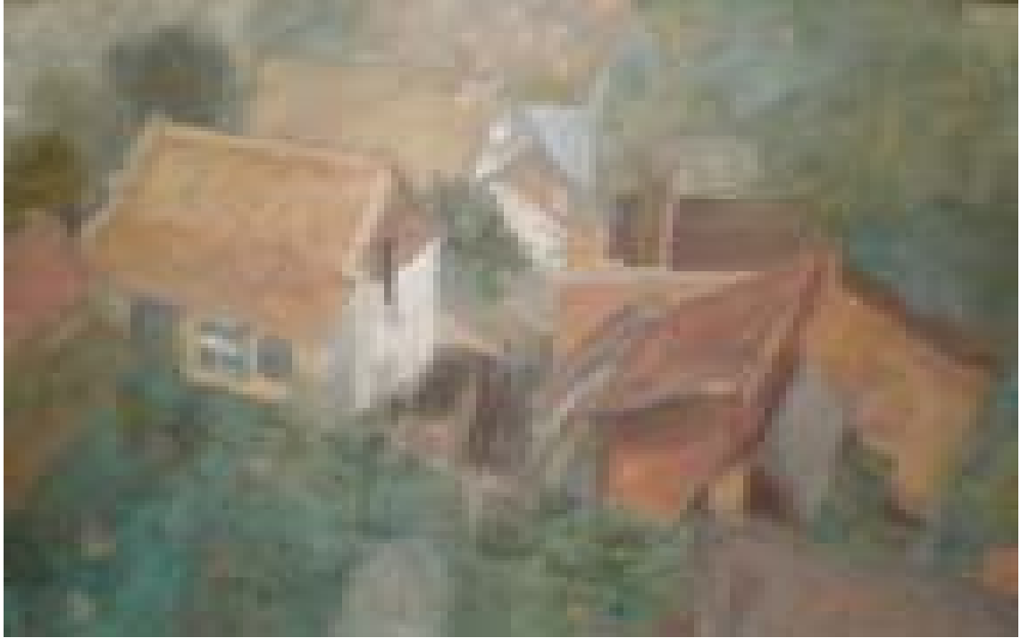
Peisaj din turn