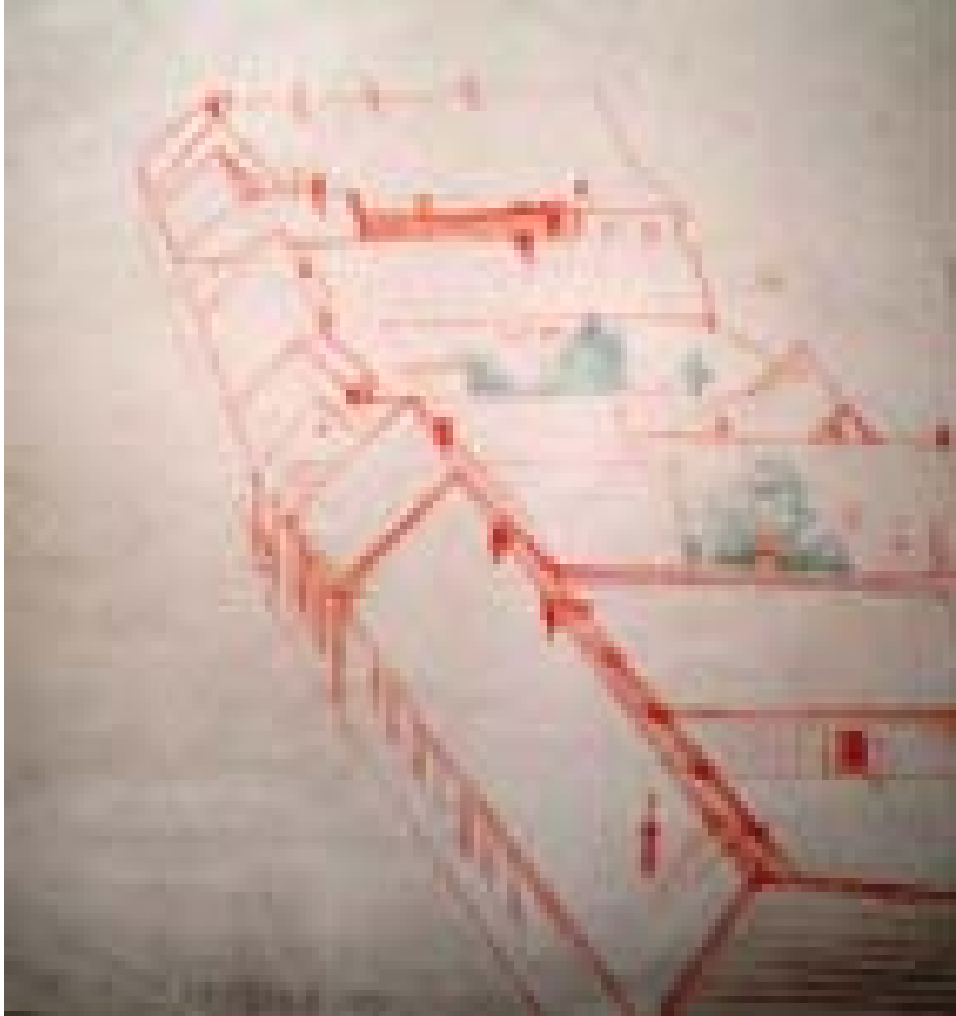
Schiță la Cenad