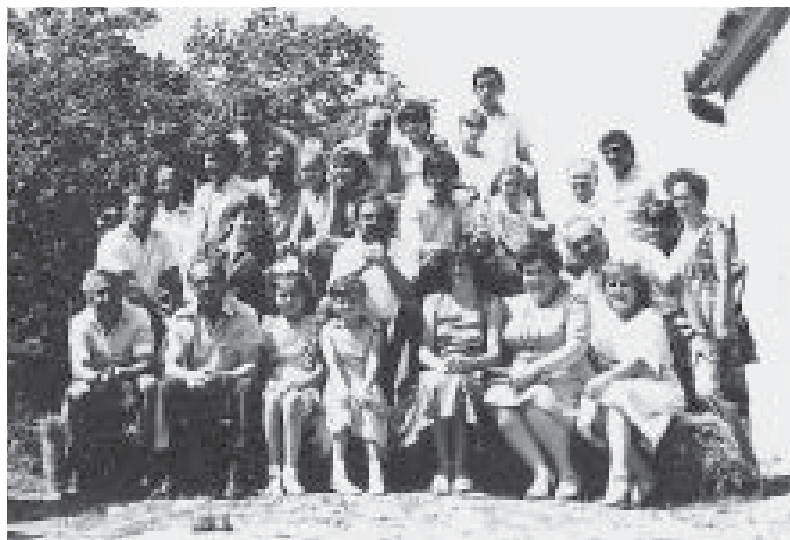
Final de tabără – 1983