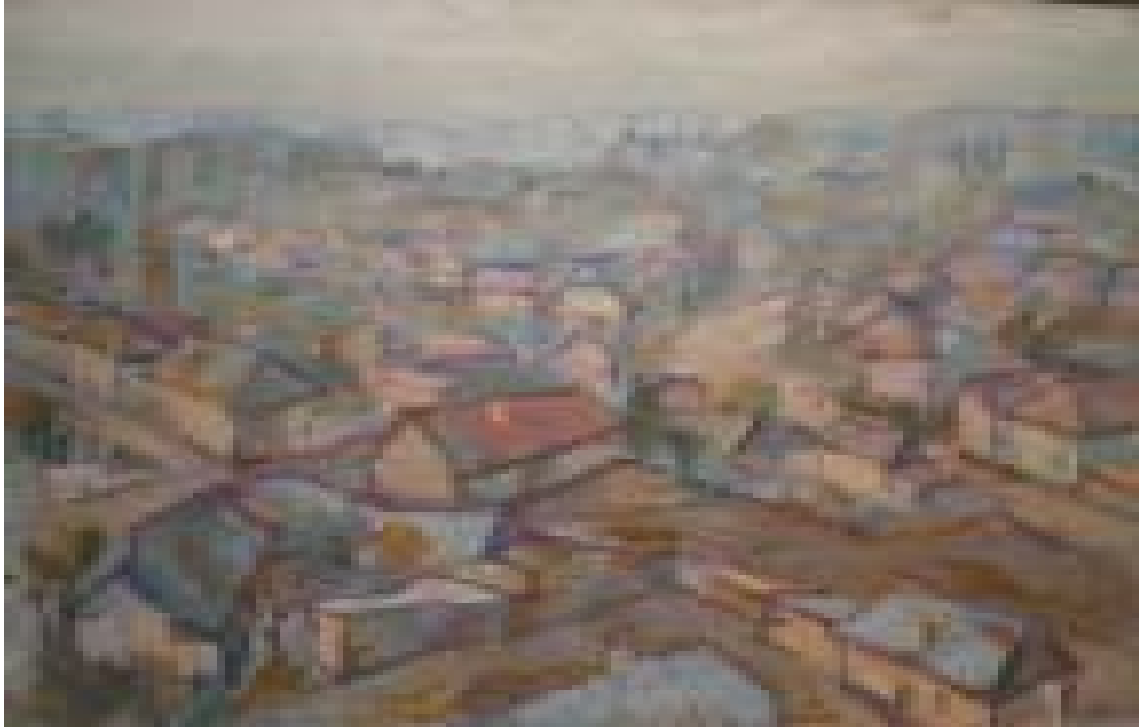
Peisaj din turn