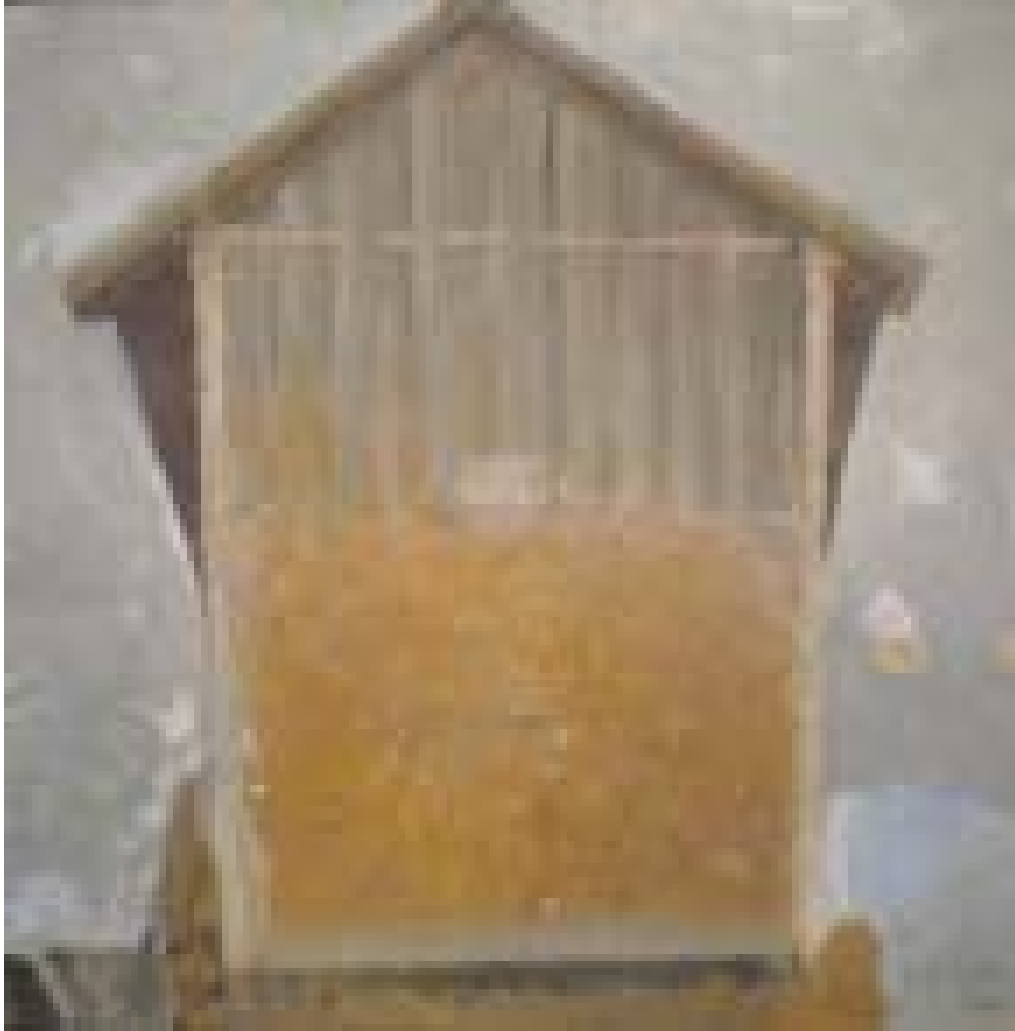
Pățul la Cenad