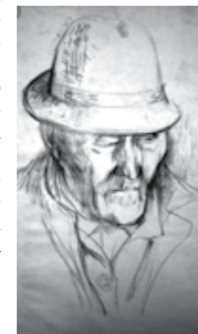
Tata - Desen de Emilia Jivanov (Cenad)