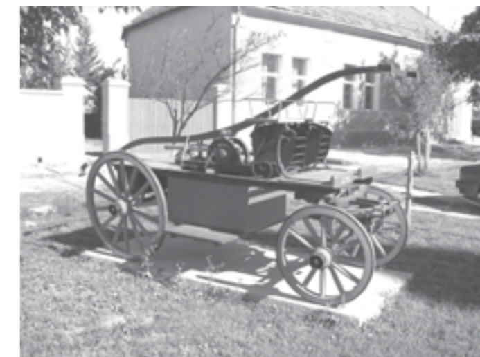
Stingător de incendiu bazat pe forța manuală și tractat de cai, aflat în parcul din centrul Cenadului

Întâmplător, am dat de câteva date concrete, legate de pompierii cenăzeni, la Direcția Județeană Timiș a Arhivelor Naționale, date pe care vi le oferim și dumneavoastră, cu speranța că, după apariția acestui material, vor ieși mai multe informații la iveală.