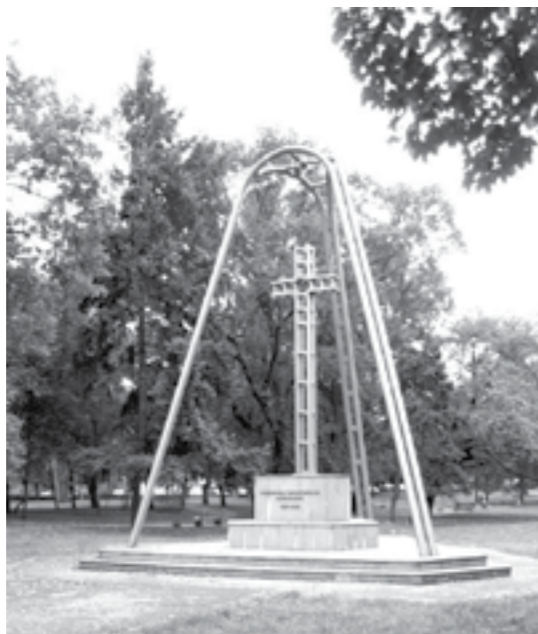
Monumentul Deportatilor în Bărăgan, situat în Parcul Justiției din Timișoara

Când ni s-a permis în cele din urmă să ne întoarcem în ținutul nostru natal secretarul primăriei de atunci, sârb