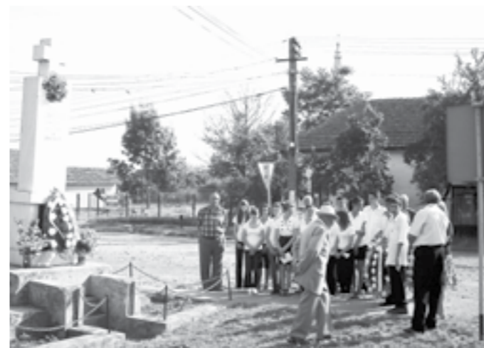
Copiii, la Monumentul Eroilor din centrul localității

De Înălțarea Domnului (Ispasul) se sărbătorește Ziua Eroilor. Evenimentul a fost marcat, pe 2 iunie a.c., prin depunerea de coroane de flori la monumentele eroilor cenăzeni căzuți pe câmpurile de luptă din cele două războaie mondiale ale secolului trecut.