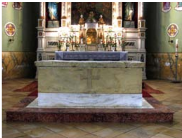
Sarcofagul în care s-a aflat trupul neînsuflit al Sfântului Gerard. Actualmente, slujește ca altar la Biserica Romano-Catolică din Cenad

(7) Urcînd astfel împreună în corabie, veniră la Zadria, unde, orînduind cele de trebuință pentru hrană, și punînd cărțile pe măgarii lor, luară o călăuză cu sine, pe nume Crato, care știa drumurile și potecile acelor locuri, ce-i duse, la porunca stăpînului său, pînă la Engat, unde luînd altă călăuză, zisul Crato se îndreptă către răsărit.