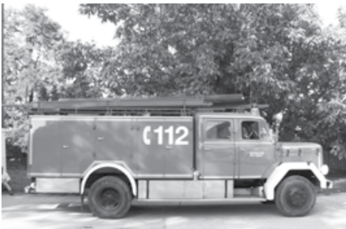
Autoutilitară de intervenție aflată la dispoziția pompierilor din localitate

de pompieri (presupunem voluntari) format din 20 de persoane, deci cu cinci mai mulți decât pe 28 februarie. Aceștia se puteau baza pe trei pompe de mână, pe două scări obișnuite și pe 18 metri de furtun în stare bună. Cantitatea de apă de care dispuneau în permanență era de 2.000 de litri, stocată în trei sacale. Pompierii mai aveau: 18 topoare de pompier, patru lopeți de fier, 10 furci de fier, opt cângi de fier, trei găleți de tablă, două felinare de petrol, 18 coifuri de pompier, două sape și o trăsură pentru rechizite. Remiza își avea sediul la nr. 252.