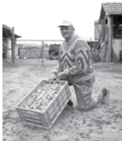
În ladă, morcovi unul și unul...

Piști nu deține firmă, nu este persoană fizică autorizată, ci