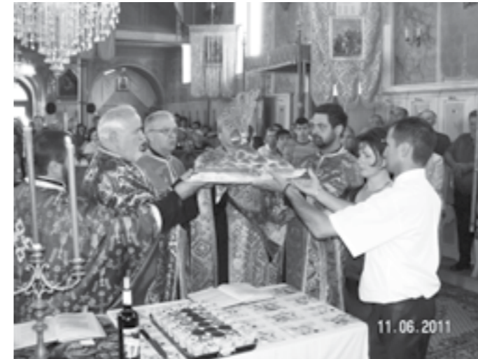
Un moment important: tăierea colacului

Evenimentul și sărbătoarea Pogorării Sfântului Duh, la cincizeci de zile după Învierea lui Hristos, au fost anunțate din Vechiul Testament ca profeții mesianice (Ioil 3,1; cf. Fapte 2, 1-21).