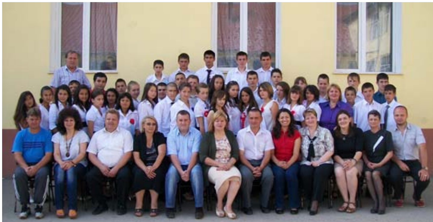
Absolvenții claselor a VIII-a de la Școala Generală Cenad, alături de profesorii lor, în iunie 2011