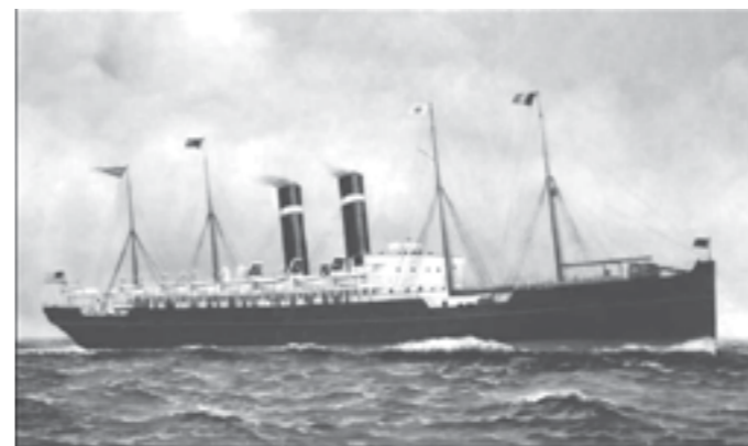
„Finland”, unul dintre vasele de linie care au transportat emigranți europeni în S.U.A., identic cu „Vaderland”

În perioada cuprinsă între anii 1892-1924, pe Insula Ellis (Ellis Island) din New York au debarcat peste 22 de milioane de imigranți, aici funcționând un