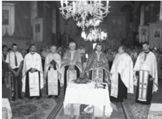
Preoții la slujba divină

De ziua mutării moaștelor Sfântului Nicolae, în duminica din 22 mai 2011, la ora 5 după-amiază, la Cenad au început Vecernia și tăierea colacului de sărbătoare. În biserica plină de credincioși și oaspeți au servit slujba divină: protopopul-stavrofor