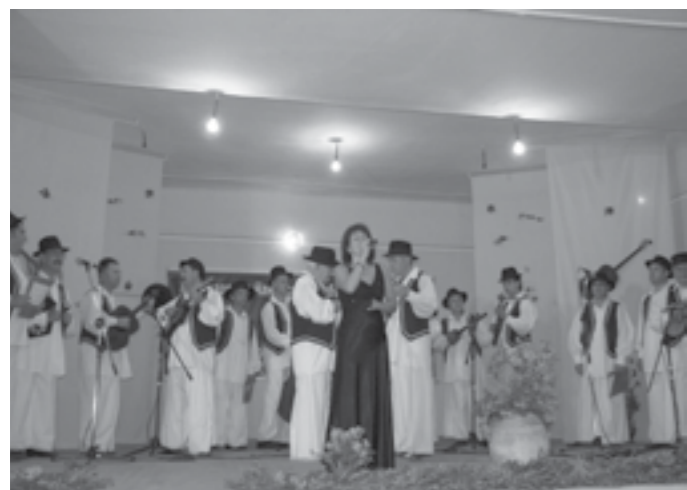
Aspect de la Festivalul Internațional al Tamburașilor Cenad din anul 2009

Consiliul Local al comunei Cenad a supus dezbaterii și a adoptat pe 19 decembrie 2011 Hotărârea nr. 44 privind aprobarea agendei cultural-sportive pe anul 2012. În linii mari, consilierii au rămas consecvenți în a sprijini acele activități care, într-un fel sau altul, promovează cu prioritate imaginea comunei în țară și străinătate. Intrată în cel de-al XIX-lea an de apariție neîntreruptă, revista „Cenăzeanul” se bucură de un buget de 2500 de lei. De aceeași sumă va avea parte și editarea unui volum al scriitorului cenăzean Geo Galetaru. Echipa locală de fotbal are prevăzut un buget de 15000 de lei. „Ghidul cenăzeanului”, deja apărut și intrat în posesia cenăzeanilor, a avut alocată suma de 2000 de lei. De 8 martie, organizatorii „Zilei femeii” vor beneficia de 1000 de lei. Participanții din Cenad la